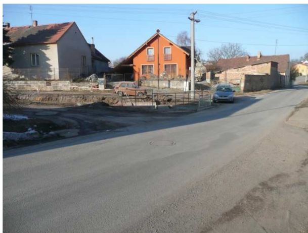
Pohled na silnici od Malesic, zleva se napojují dvě cesty