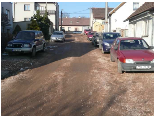
Parkující automobily podlé cesty