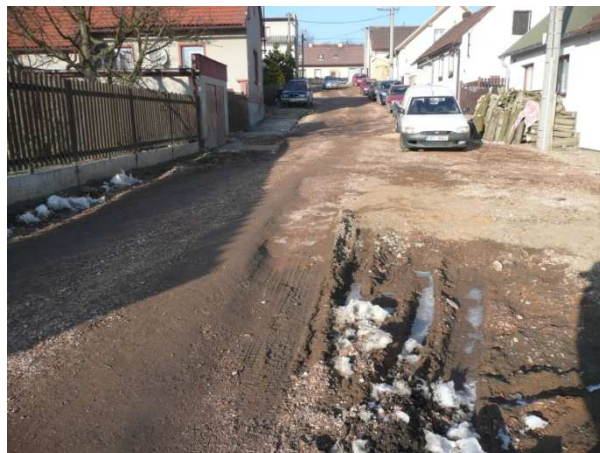
Trvale sjízdná cesta pouze v jednom jízdním pruhu