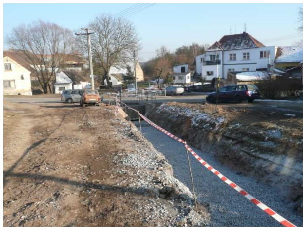
Pohled od cihelna k silnici III/18051, podél zatrubňované vodoteče dnes vedou dvě cesty